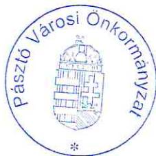
Dénes Anita Bírálbizottság elnöke