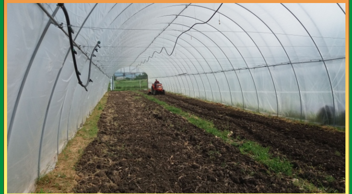
Fólia gépi ásása