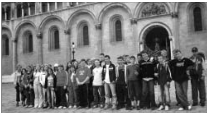
Pécsi székesegyháznál a kétnapos osztály kiránduláson

Az első napon először az egykori római kori Sopiane város – 2000-ben a világörökség részévé vált – ókeresztény temető együttesét tekintettük meg. Ezt követően az államalapítónk idejében épült székesegyház, a török időben épült Gázi Kászim pasa dzsámia, a város legrégebb lakóháza, majd a Zsolnay Múzeum büvölt el minket. Felejthetetlen élmény marad mindannyiunknak a Misina tetőn található 176 m magas televíziótorony tetejéről nyílt kilátás a városra és a Mecsek-hegységre. Esti városnézésünk a romantikus nosztalgia vonattal feltárta nekünk a város szinte valamennyi titkát a Barbakántól a Havi-hegyi