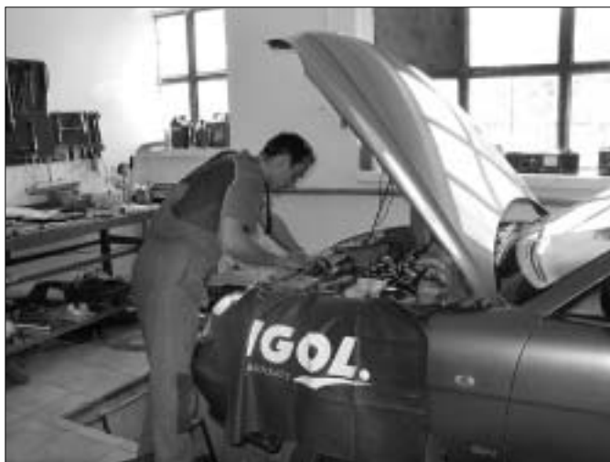
A gyors szervizben az általános karbantartási munkák mellett klímajavítást, szélvédőcserét és futómű beállítást is végeznek