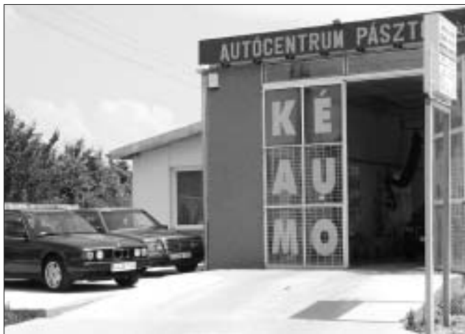
Az Autócentrumban minden márka szakemberére talál

bérletes rendszert, vagyis minden tizedik mosás után egy ingyenes mosást, minden negyvenedik mosás után egy ingyenes polírozást, vagy kárpittisztítást végzünk ügyfeleink járművén. Ezen kívül motorkerékpárok szervizelésével és