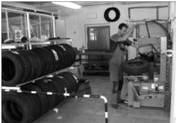
A gumiköppenyek szerelése külön műhelyben történik