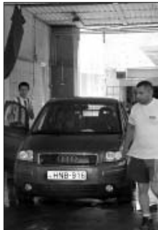
Audi A2 a mosóban